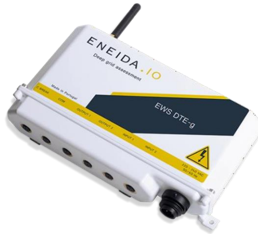
Gateway IoT para a monitorização do QGBT e medição de terras.