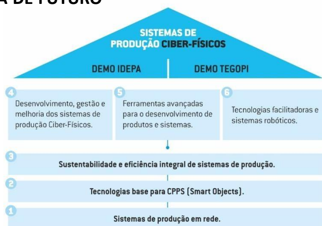
Figura 1 - Estrutura do Projeto