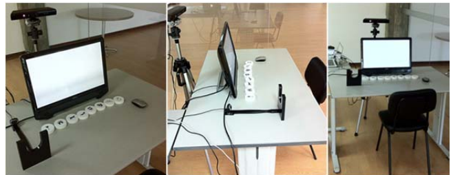
Figura 1. Aparato usado na experiência.

Os testes foram realizados numa sala fechada com luz artificial e o setup, apresentado na Figura 1, consistia num ecrã de toque de 22", uma barra de sensor Kinect, uma webcam, oito peças tangíveis marcadas com fiduciais e um rato de computador.