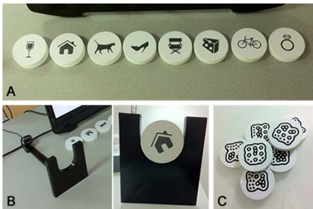
Figura 2. (a) Ordem das peças tangíveis usadas na experiência; (b) Aparelho com a webcam adaptada para reconhecimento dos fiduciais; (c) Fiduciais rotulados no verso das peças.

A primeira e segunda tarefas consistiam na utilização do rato e toque, respetivamente, como modalidade de input. Já a terceira tarefa abrangia a interação através de objetos tangíveis, sendo necessário para a seleção do botão correto a escolha de uma das oito peças físicas disponíveis rotuladas com os ícones correspondentes aos nomes dos botões (Figura 2). Era pedido aos participantes que levantassem a peça pretendida e a inserissem num mecanismo com uma webcam preparado especificamente para o estudo. Aqui, o sistema iria reconhecer o ID do fiducial gravado no verso da peça.